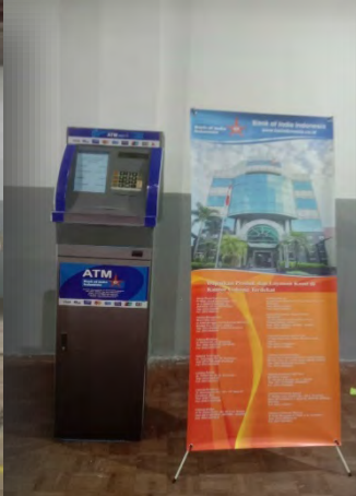
Miniatur Mesin ATM Bank Untuk menarik minat Pelajar