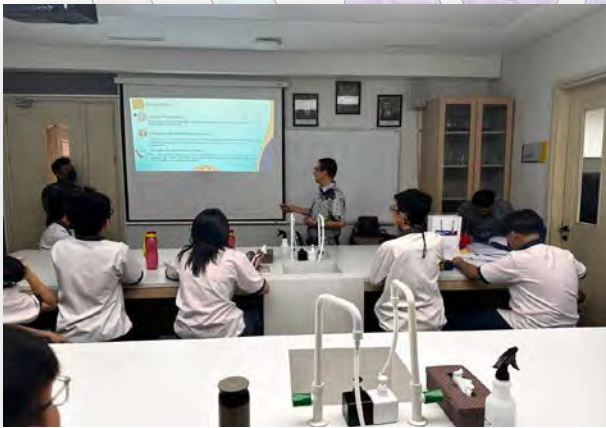
Seminar Edukasi Keuangan