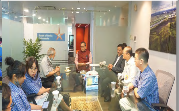
Diskusi bersama Direksi saat Perkenalan