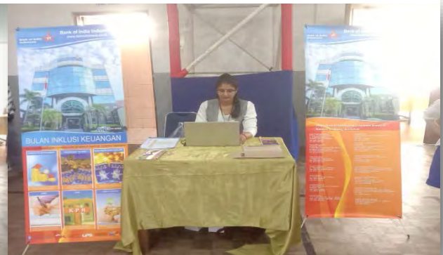
Bank memfasilitasi Pembukaan Rekening Tabungan bagi Pelajar yang berminat