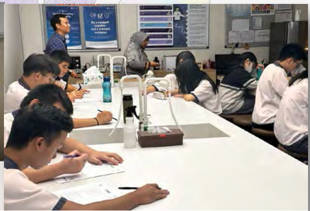
Pelajar mengisi Lembar Kuis pre test dan post test