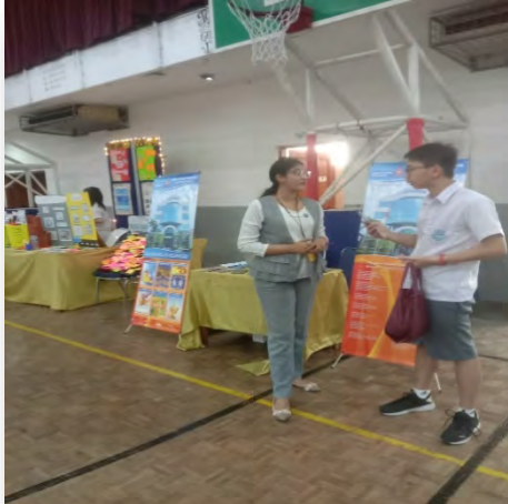
Petugas Bank pada saat mengedukasi Pelajar di Gandhi School Ancol