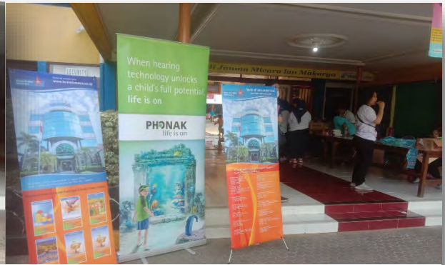
Registrasi Peserta Fun Bike, 5 Agustus 2023