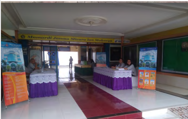
Registrasi Acara Puncak Lustrum VIII, 6 Agustus 2023