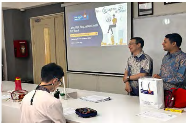
Ada sesi tanya jawab pada saat pemaparan materi