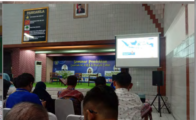
Penayangan Logo Bank sebelum acara puncak dimulai