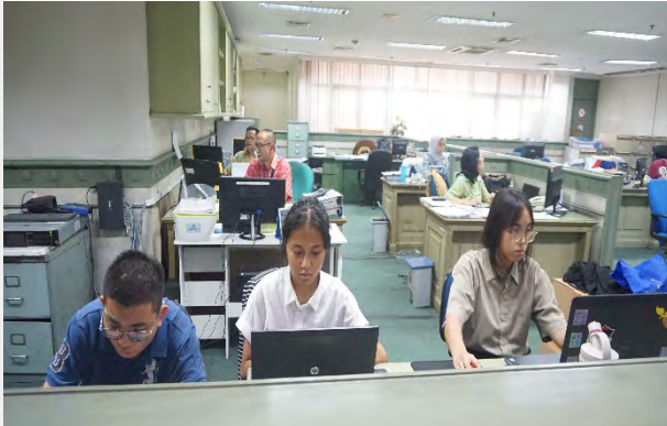
Pelajar SLB B Pangudi Luhur saat magang di Bank