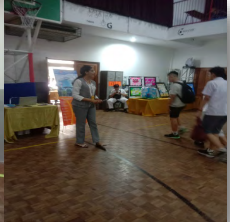
Selain kegiatan Edukasi Keuangan, juga membagikan brosur produk tabungan