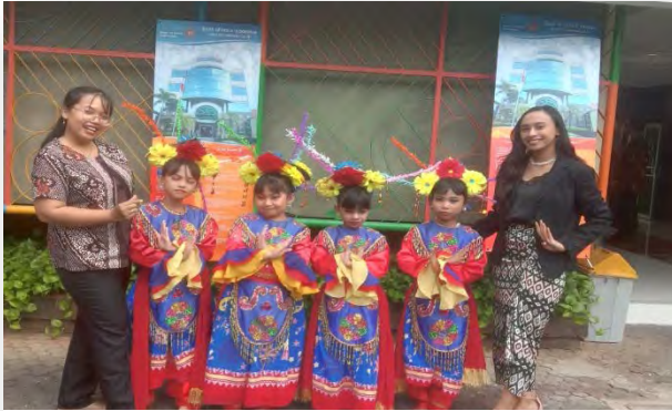
Peserta Pentas Seni SLB B Pangudi Luhur