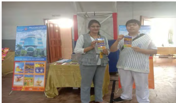
Foto bersama dengan salah satu Pelajar Gandhi School yang mendapatkan Edukasi Keuangan secara langsung.