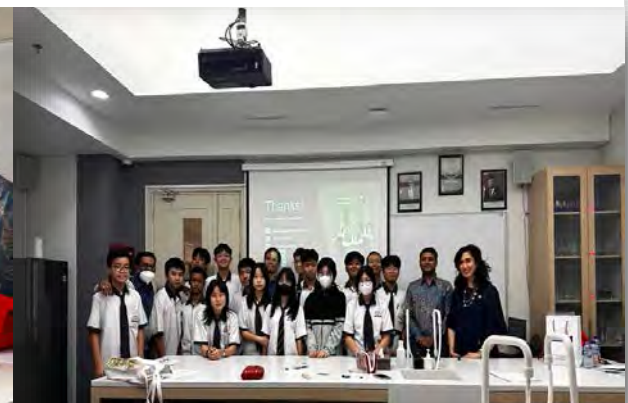
Foto Bersama seluruh peserta Edukasi Keuangan