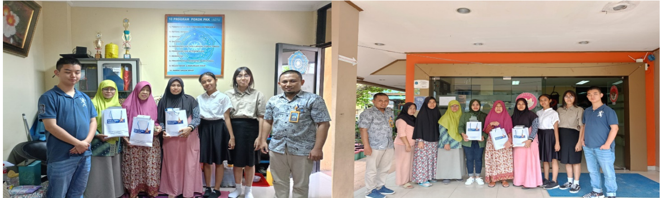
Foto Bersama Perwakilan Anggota PKK dan Peserta Edukasi Keuangan di Kantor PKK Kelurahan Kartini, Jakarta Pusat.